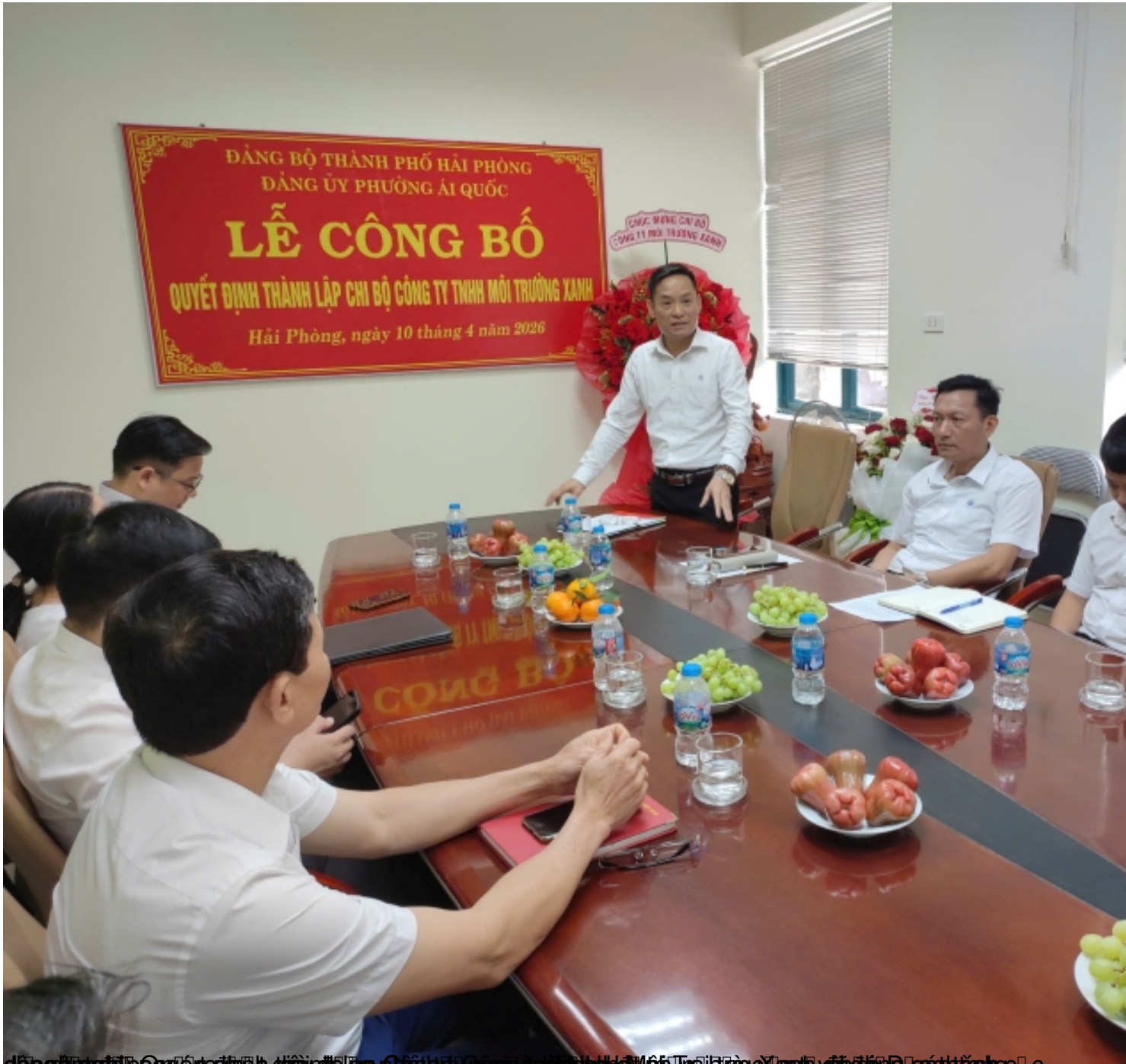
đồng nghiệp Công ty đã định ngày 10 tháng 4 năm 2026 tại Công ty TNHH Môi Trường Xanh và đồng nghiệp c

Thứ ba, 14 Tháng 4 2026 01:42 - Cập nhật lần cuối Thứ ba, 26 Tháng 5 2026 03:26